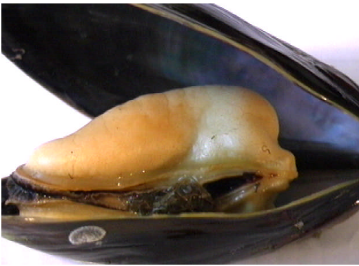
Kræklingur sem farið hefur í suðu lifandi.