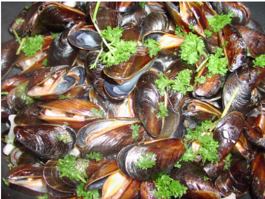
Kræklingur tilbúinn til neyslu.