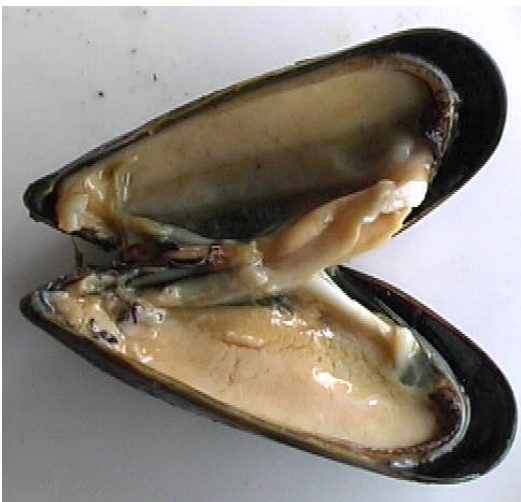
Kræklingur sem farið hefur í suðu frystur.

vel yfir sumarið og fram á haust en holdfylling minnkaði þá vegna minnkandi fæðu. Þegar líða fór á veturinn minnkaði hlutfall sterkju og fitu verulega. Í mars jókst fæðuframboðið aftur en kræklingurinn jók ekki við þyngd sína fyrr en að lokinni hrygningu en þá jókst hlutfall sterkju og fitu mest. Hafa skal í huga að þurrefnainnihald (holdfylling) og efnainnihald kræklinga hér á landi eftir árstíma er frábrugðið því sem kemur fram á myndinni þar sem hrygningartími kræklinga við Ísland er annar en við Skotland.