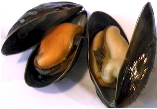
Hold ræktaðs kræklinga er mýkra en þess villta og í honum finnast yfirleitt ekki perlur.