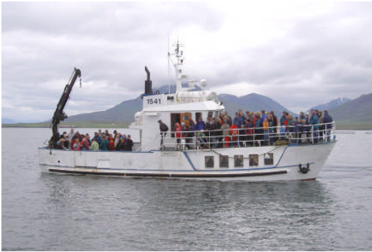
Kræklingarækt við Hrísey kynnt fyrir ferðamönnum og kræklingur matreiddur um borð.

aðferðir eru notaðar til að kynna krækling og auka neysluna. Algengt er að haldnar séu skelfiskhátíðir yfir aðaluppskerutímam og hefur þeirri aðferð verið beitt hér af Norðurskeljar ehf. í Hrísey. Jafnframt hefur Norðurskel kynnt ferðamönnum kræklinga-ræktina og kræklingur verið matreiddur og borinn á borð.