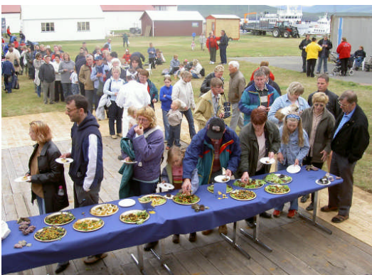
Frá skelfiskhátíð í Hrísey 5. júlí 2003.

tonn en dregið hefur úr útflutningi þaðan á síðustu árum. Danmörk hefur flutt út um 40.000 tonn af villtum kræklingi árlega undanfarin ár. Útflutningur Evrópulanda er að mestu innan Evrópu.