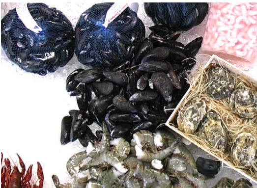
Lifand kræklingur til sölu í lausu ásamt öðru fiskmeti.

Innflutningur á kræklingi eftir löndum skv. tölum frá FAO.