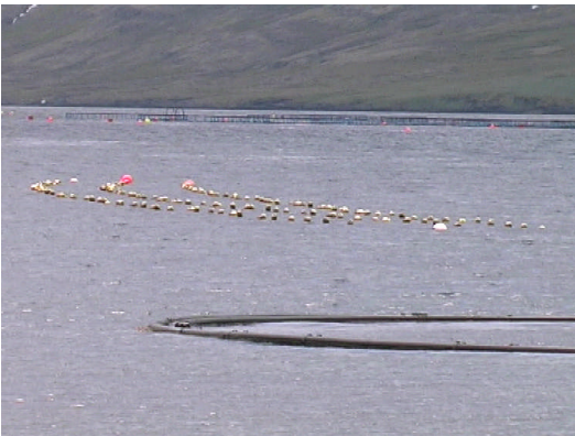
Kræklingarækt í Mjóafirði.