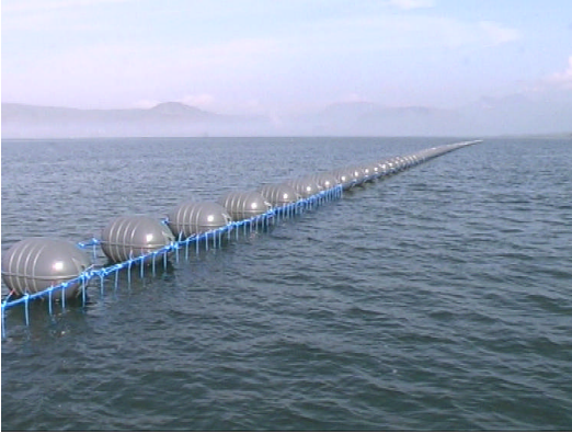
Kræklingarækt í Hvammsvík í Hvalfirði.