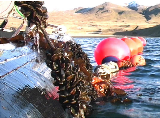
Kræklingalína við Bjarteyjarsand í Hvalfirði.