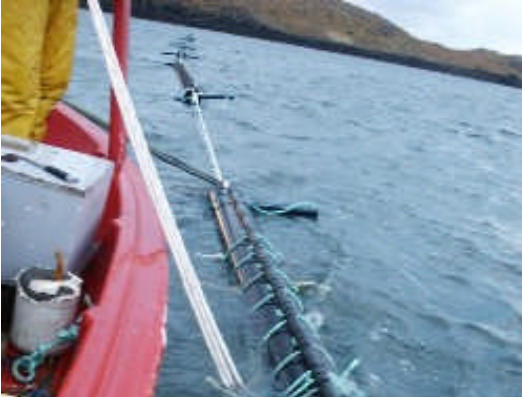
Kræklingarækt við Purkey í Breiðafirði.