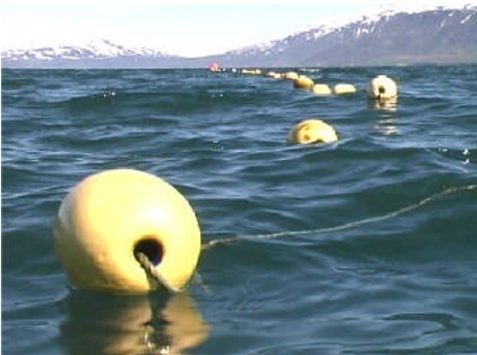
Kræklingarækt í Eyjafirði.