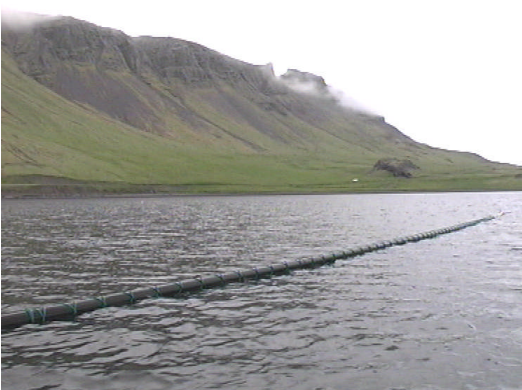
Kræklingarækt í Hvammsvík í Hvalfirði.